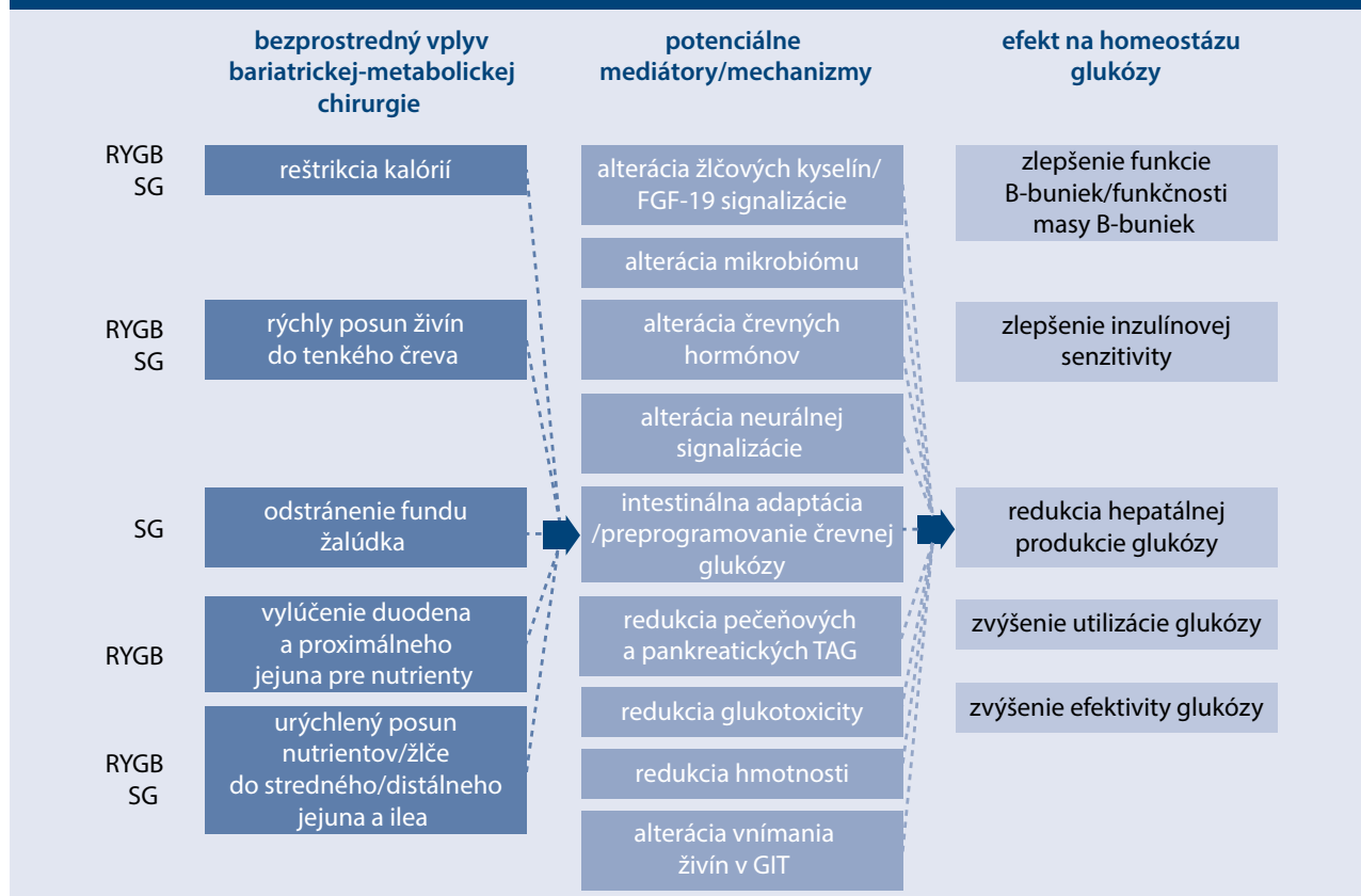
Schéma 2 | Mechanizmy vedúce k zlepšeniu homeostázy glukózy po bariatrickej-metabolickej chirurgii. Upravené podľa [33]

FGF-19 – ileom derivovaný enterokín GIT – gastrointestinálny trakt RYGB – RY gastrický bypass SG – sleeve/rukávová gastrektómia TAG – triacylglyceroly