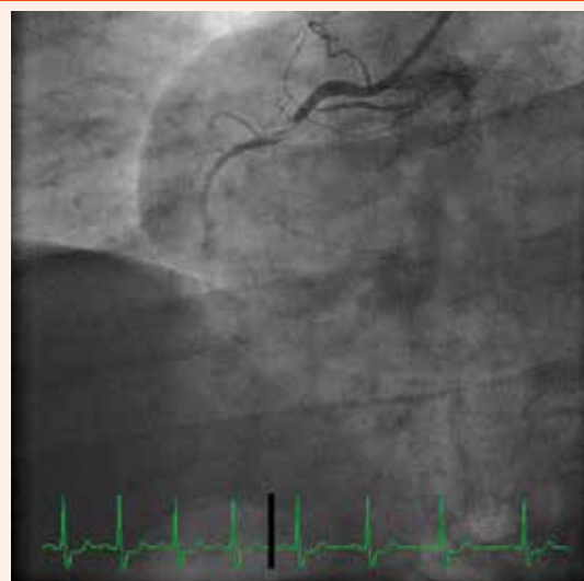
Obr. 5. Hemodynamicky významná tandemová stenóza RIA.