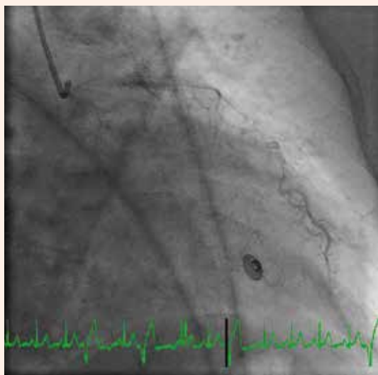
Obr. 3. Pacientka s koronárnym syndrómom X, pokračovanie pomalého odtoku kontrastnej látky z RIA.