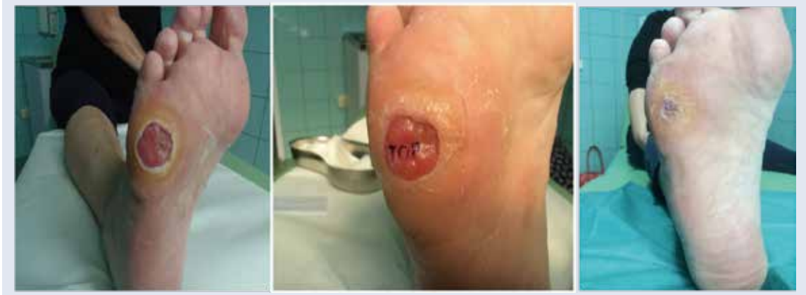
Obr. 3 | Instilácia Heberprotu-P do spodiny a okrajov dlhodobo sa nehojacej neuropatickej ulcerácie