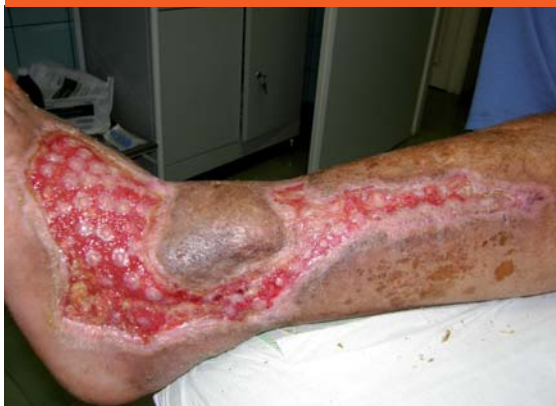
Obr. 7 Počínajúca epitelizácia rany pred demitáciou