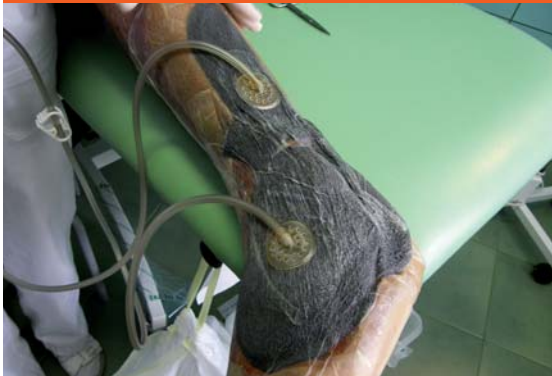
Obr. 2 Rana po debrítmente s naloženým VAC systémom