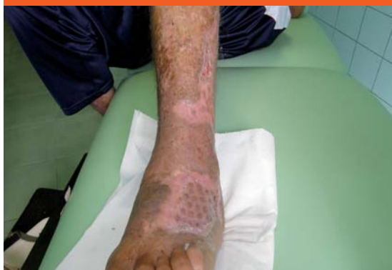
Obr. 9 Defekt po 2 mesiacoch po aplikácii dermoepidermálnych štepov