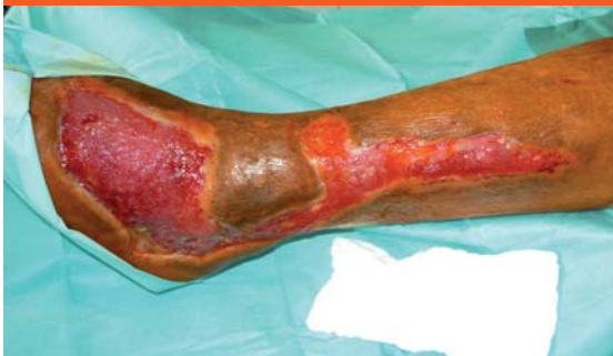
Obr. 3 Pregranulovaný defekt pripravený na implataciu dermoepidermálnych šteпов