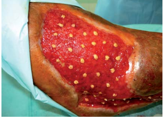
Obr. 4 Aplikované dermoepidermálne štepy na defekt