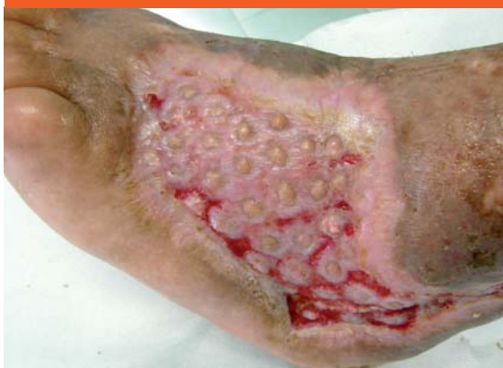
Obr. 8 Defekt po 1. mesiaci po aplikácii dermoepidermálnych štepov