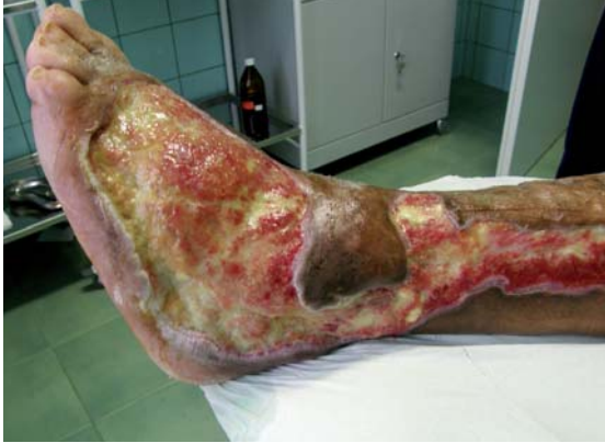
Obr.1 Defekt po nekrotizujúcom erysipele ľavého predkolenia