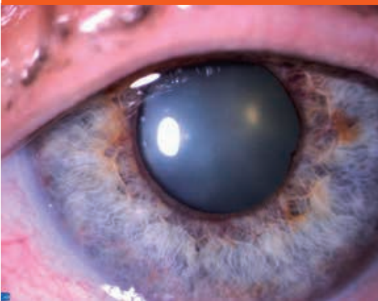
Obr. 1. Rubeóza dúhovky