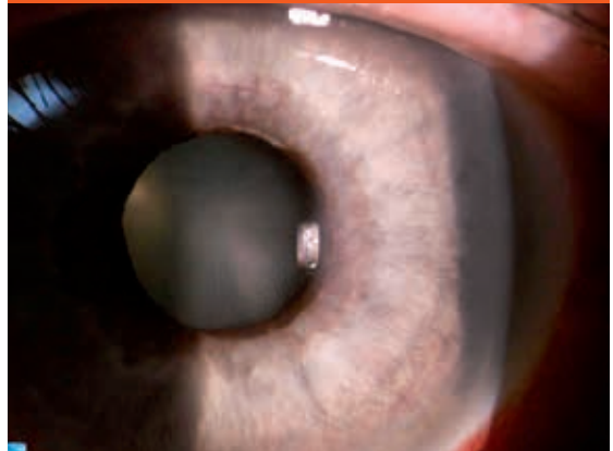
Obr. 3. Ektropium pigmentového listu dúhovky (archív II. Očnej kliniky SZU)

zrenice. Tieto nemusia byť pri vyšetrení štrbinovou lampou vo včasnom štádiu viditeľné. Pod vplyvom ďalšej koncentrácie VEGF dochádza ku vzniku fibrovaskulárnej membrány pokrývajúcej povrch dúhovky a rozširujúcej sa smerom do uhla, ktorého štruktúry prekrýva (obr. 2).